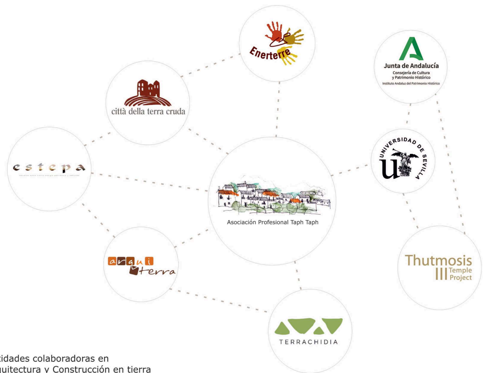
Entidades colaboradoras en Arquitectura y Construcción en tierra